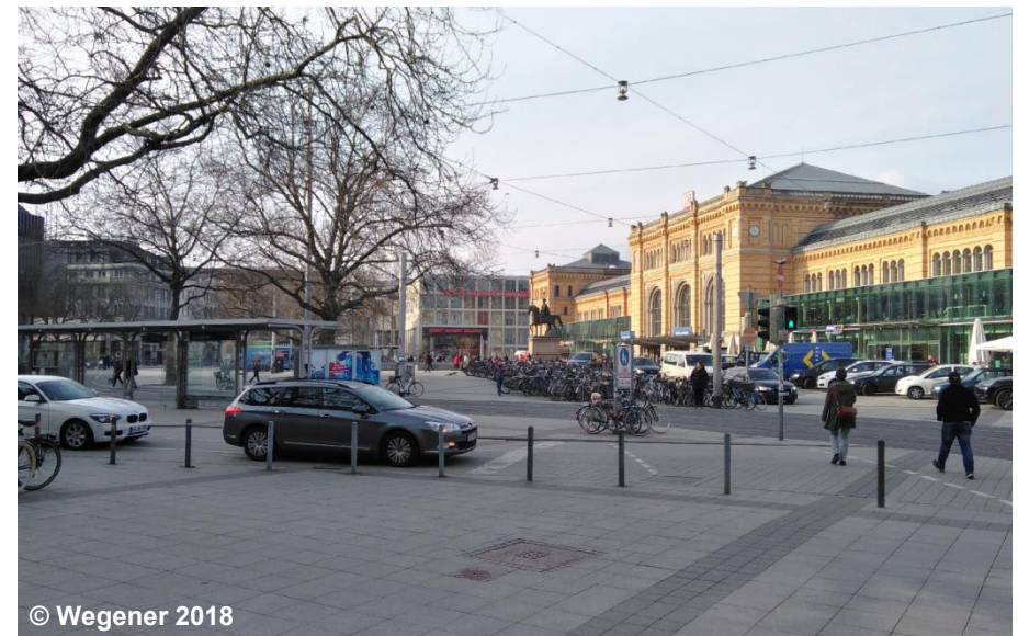
Blick auf den Platz