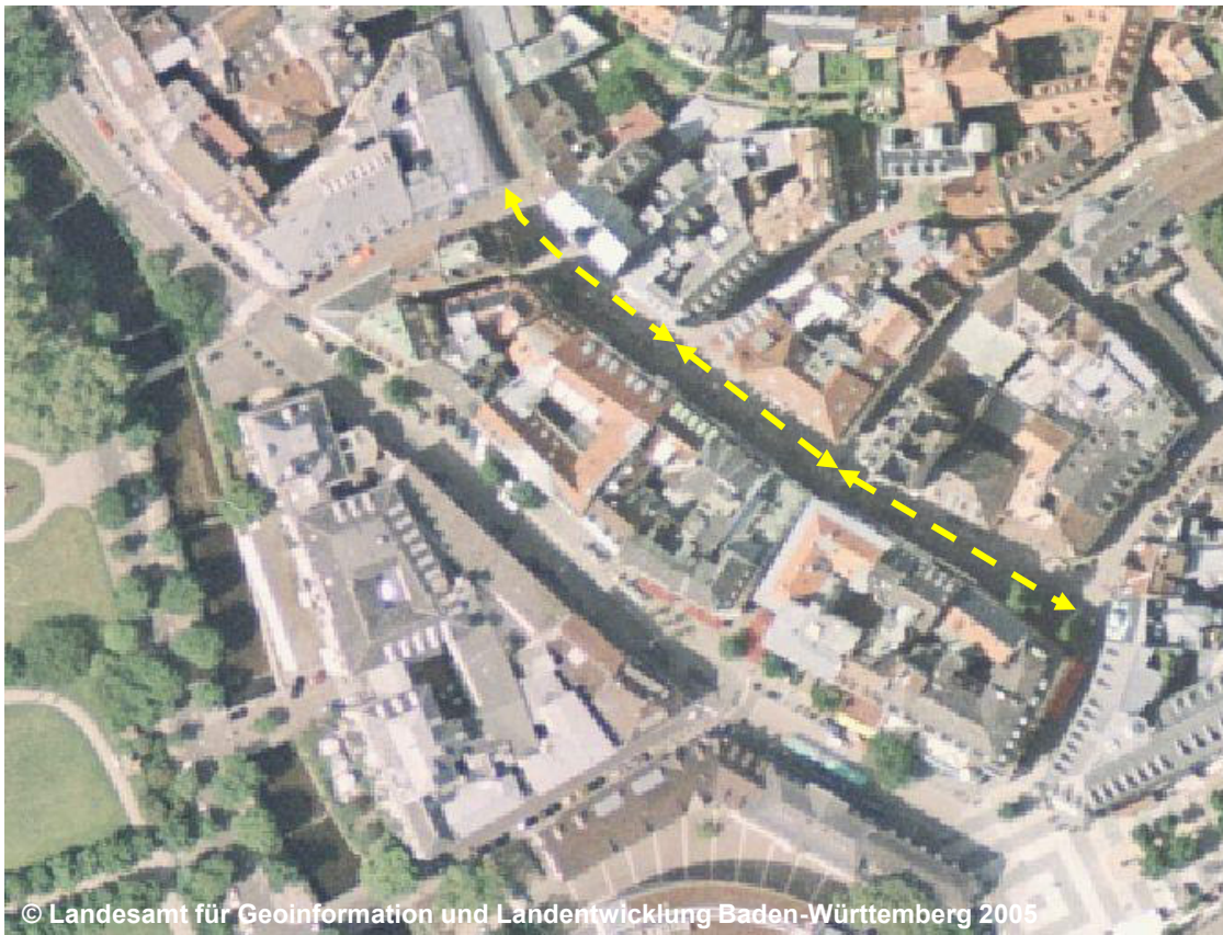
© Landesamt für Geoinformation und Landentwicklung Baden-Württemberg 2005

Die Modellierung des Objektes erfolgt auf der Grundlage von Fachinformationen.