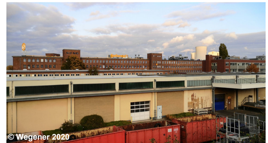
Blick auf die Industrie- und Gewerbefläche