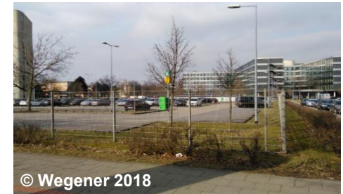
Blick auf die Fläche mit der Funktion Parken

Die Überlagerung von Objekten der Tatsächlichen Nutzung wird durch das Attribut „istWeitereNutzung“ realisiert, welches bei der abstrakten Klasse AX_TatsaechlicheNutzung eingerichtet ist und somit zwar allen Grundflächen zur Verfügung steht, jedoch nur bei einer Auswahl von Objekten (siehe Abschnitt 17.6 des Erläuterungsteil) zur Anwendung kommt. Sofern das Attribut bei einem Objekt den Wert 1000 aufweist, nimmt besagtes Objekt nicht mehr an der Themenbildung „Tatsächliche Nutzung Basis-DLM“ und somit nicht an der lückenlosen und überschneidungsfreien Beschreibung der Erdoberfläche teil.