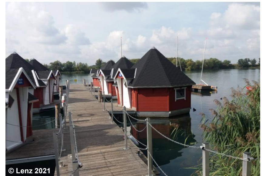
Blick auf die überlagernden Ferienhausfläche