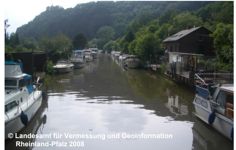
Blick auf die stillgelegte Schleuse