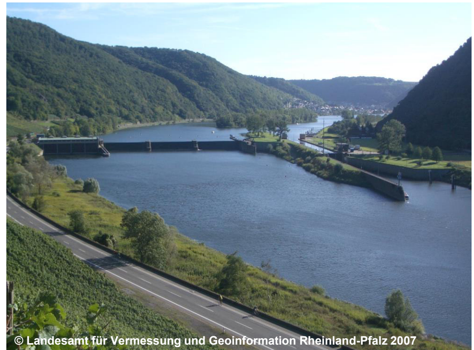
Blick auf die Kammerschleuse