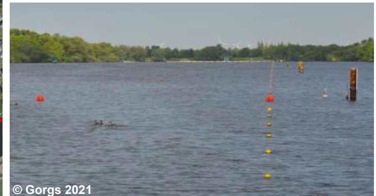
Blick auf die Wassersportanlage