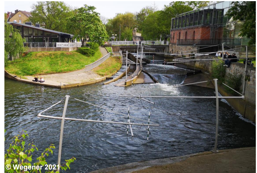
Blick auf die Wassersportanlage