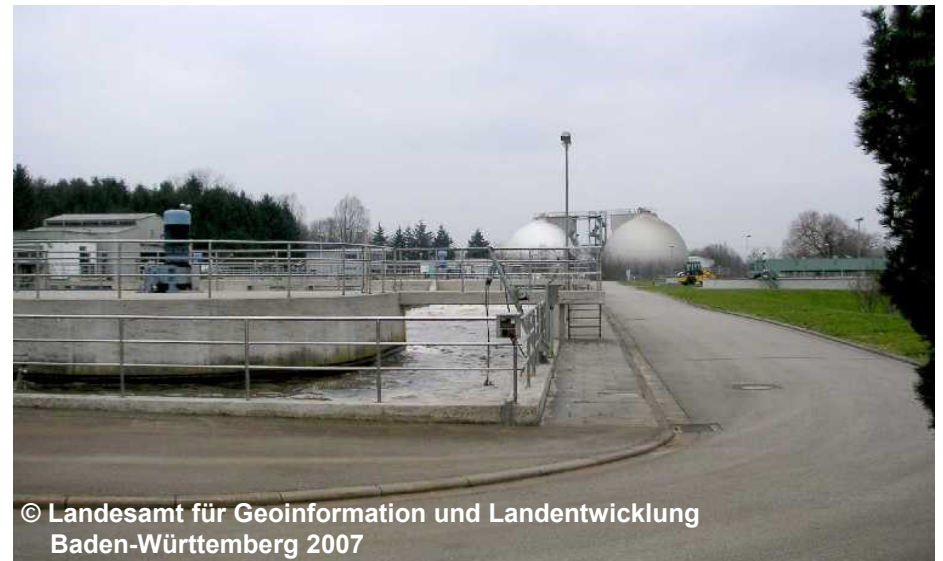
© Landesamt für Geoinformation und Landentwicklung Baden-Württemberg 2007