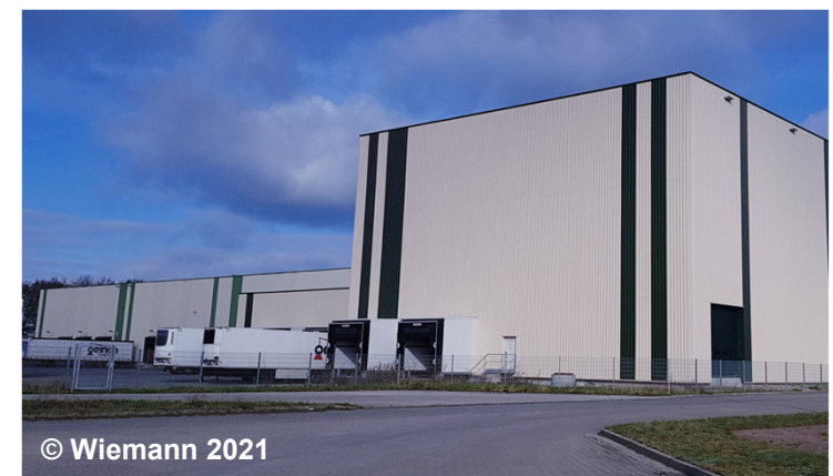
Blick auf einen Industrie- und Gewerbefläche mit der Funktion Logistik und Transport

Gehört die Funktion 1530 Logistik und Transport nicht zum landesspezifischen Erfassungsinhalt, werden diese Flächen mit der Funktion 1400 Handel und Dienstleistung erfasst