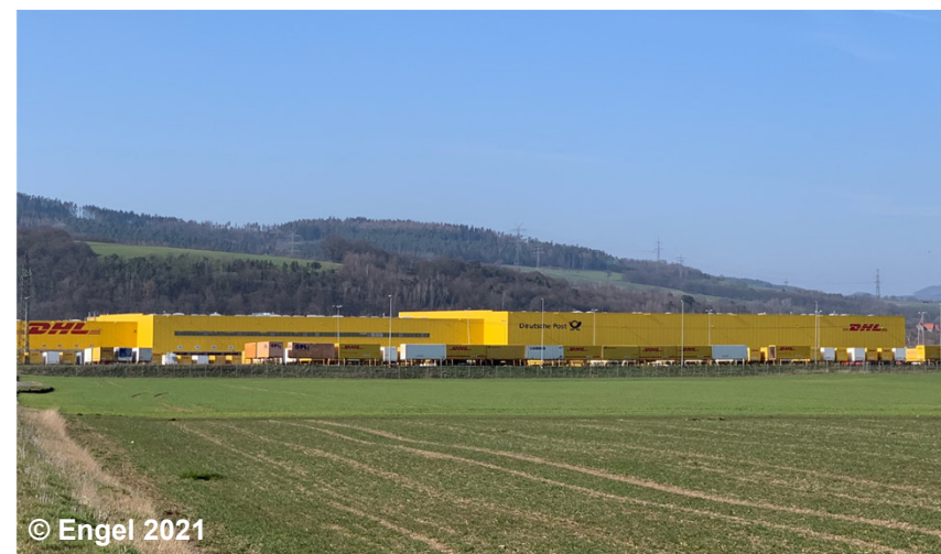
Blick auf einen Industrie- und Gewerbefläche mit der Funktion Logistik und Transport

Gehört die Funktion 1530 Logistik und Transport nicht zum landesspezifischen Erfassungsinhalt, werden diese Flächen mit der Funktion 1400 Handel und Dienstleistung erfasst