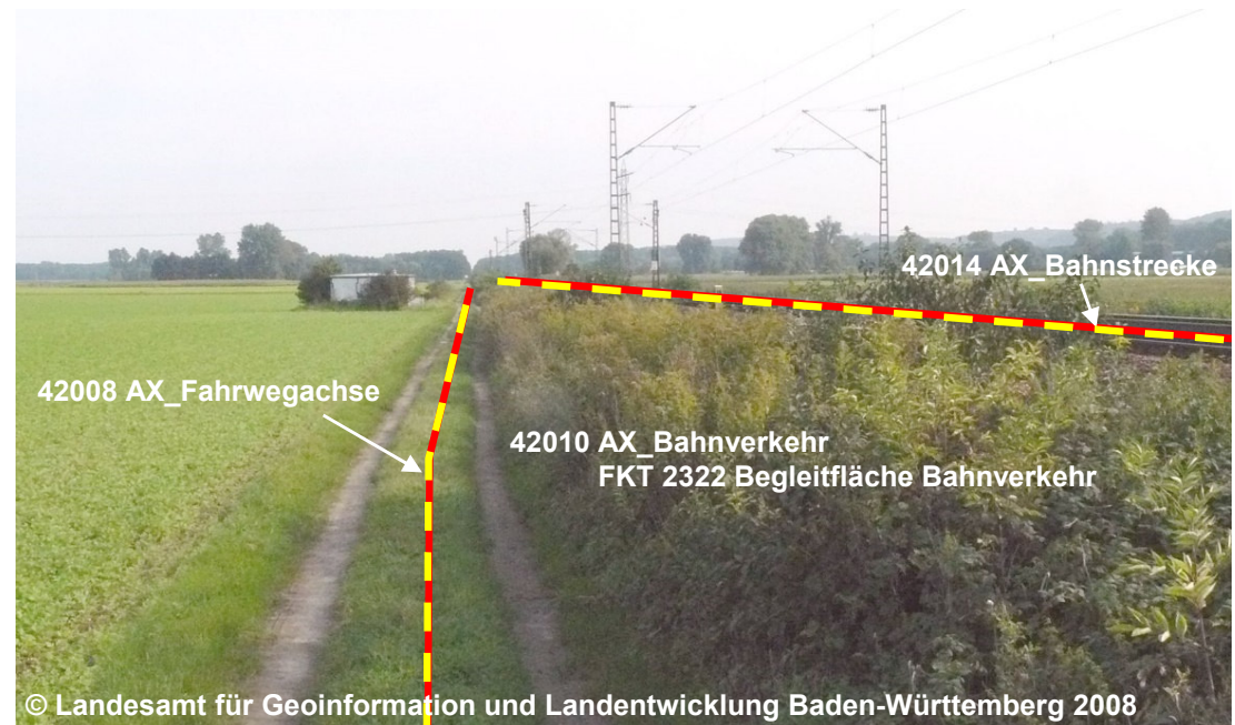
Blick auf eine Begleitfläche Bahnverkehr