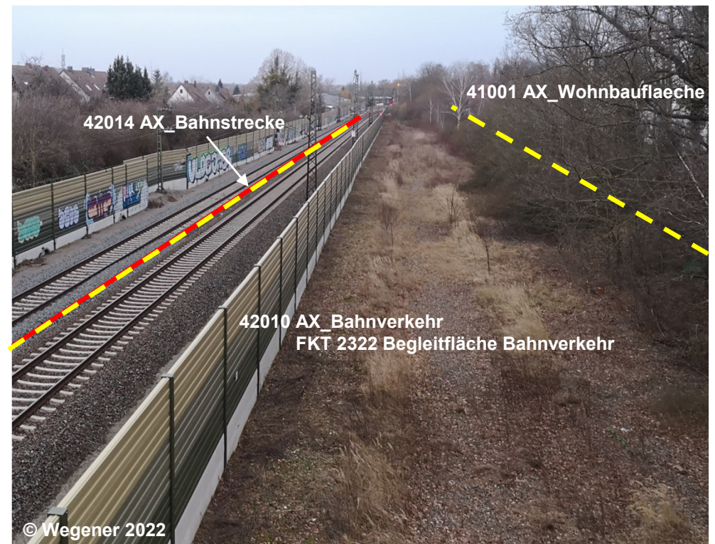
Blick auf die Begleitfläche Bahnverkehr