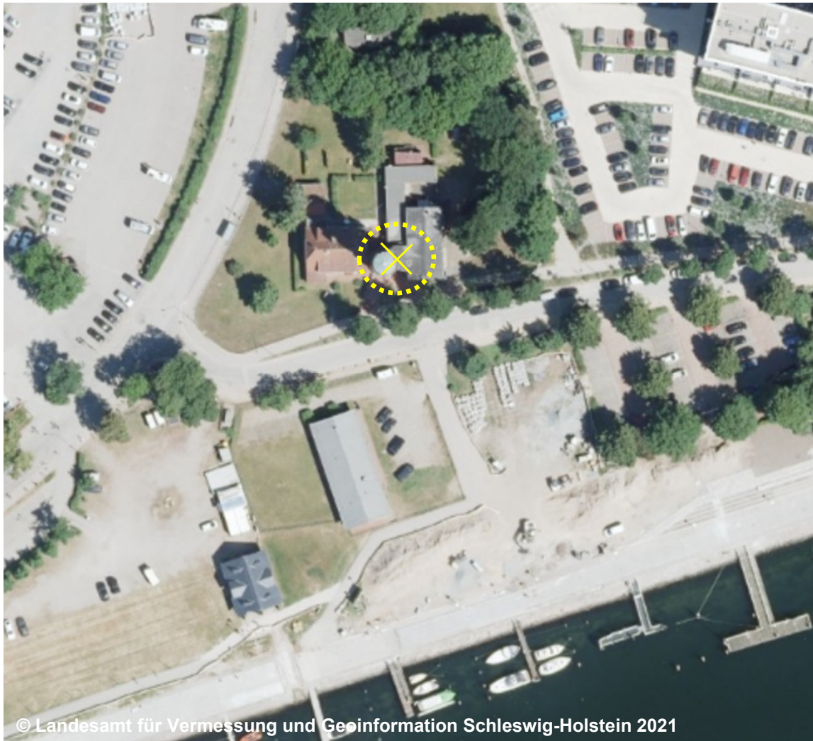
© Landesamt für Vermessung und Geoinformation Schleswig-Holstein 2021