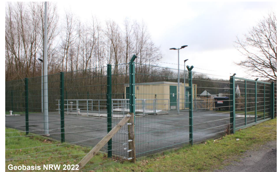
Blick auf das Pumpwerk