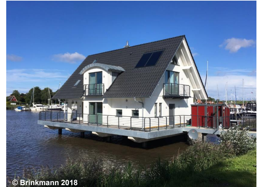
Blick auf die überlagernde Wohnbaufläche