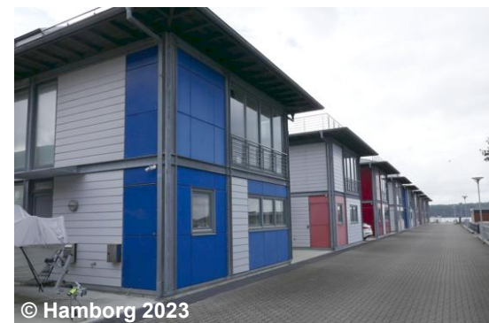
Blick auf die überlagernde Wohnbaufläche