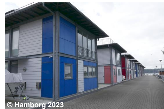
Blick auf die überlagernde Wohnbaufläche