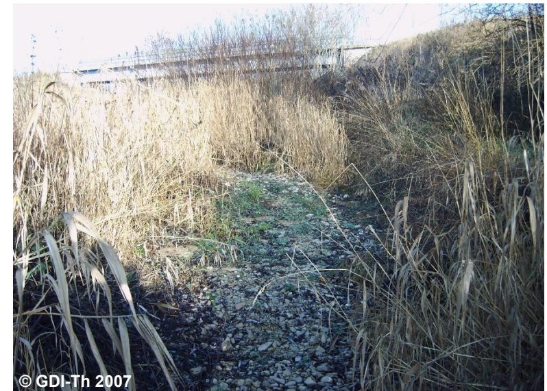
Blick auf das fast ausgetrocknete Flussbett der Helbe

Die Modellierung des Objektes erfolgt auf der Grundlage von Fachinformationen.