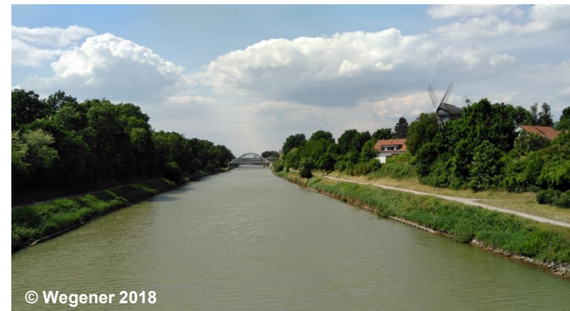
Blick auf den Kanal