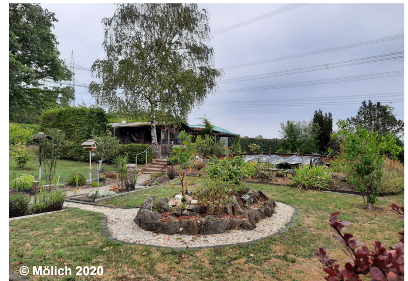
Blick auf die Erholungsfläche