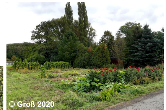
Blick auf die Erholungsfläche