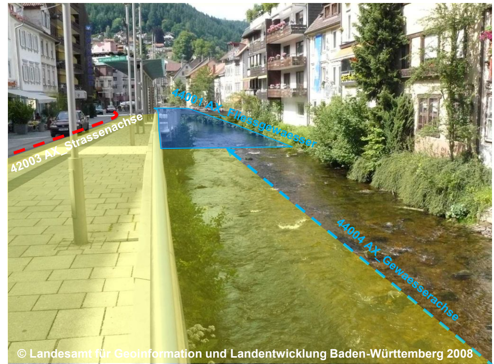
Blick auf die Begleitfläche Straßenverkehr