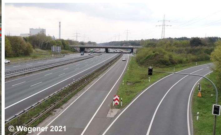
Blick auf die Begleitfläche Straßenverkehr