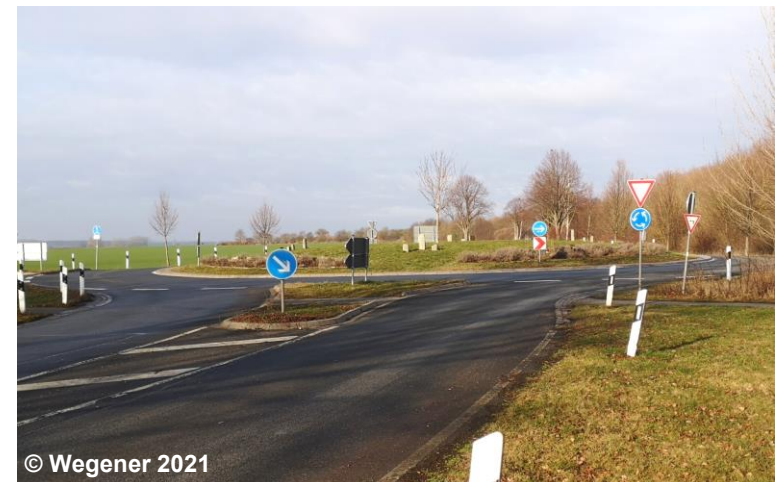
Blick auf die Begleitfläche Straßenverkehr