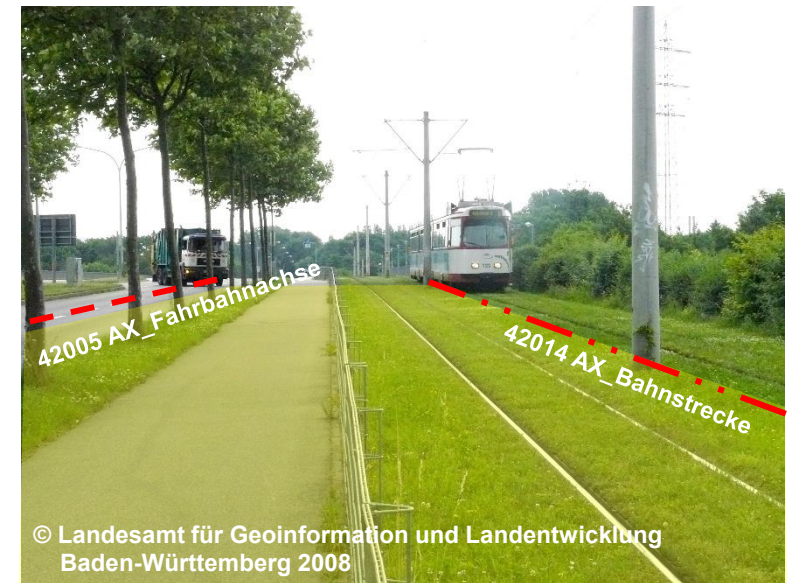
Blick auf die Begleitfläche Straßenverkehr