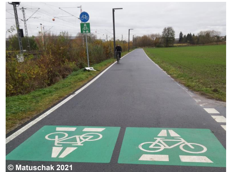
Blick auf den Radschnellweg