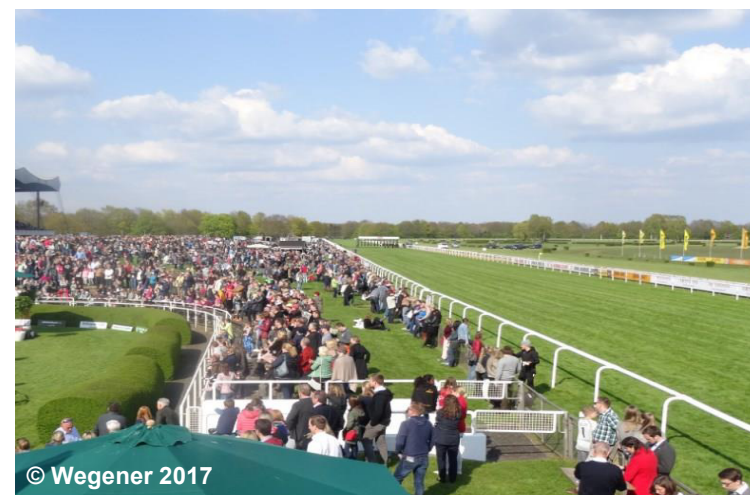
Blick auf den Reitsport