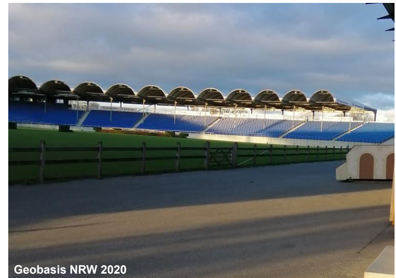
Blick auf den Reitsport