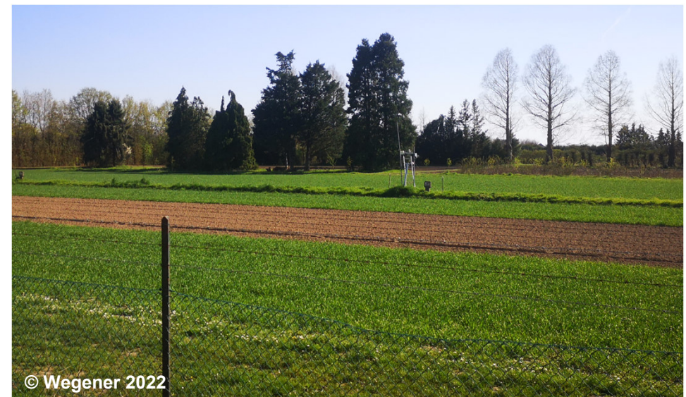
Blick auf ein landwirtschaftliches Versuchsfeld