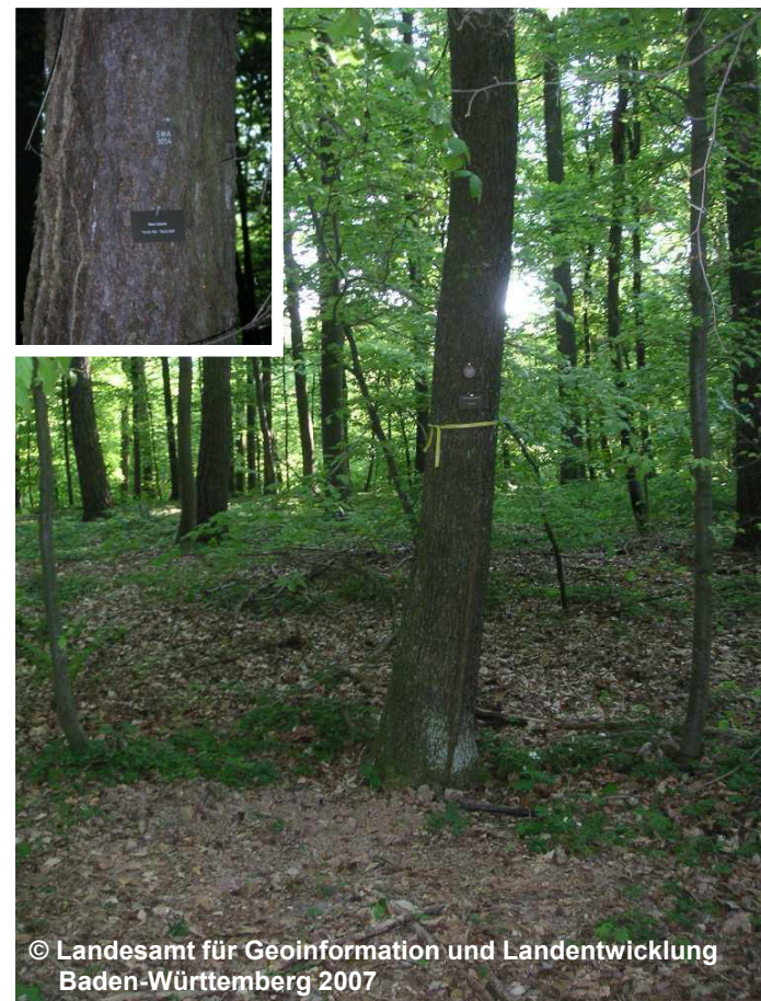
Blick in die Waldbestattungsfläche