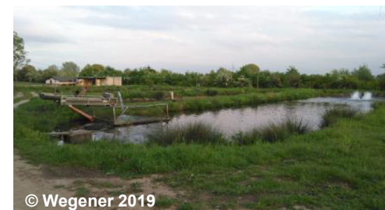
Überlagernde Fischereiwirtschaftsfläche auf der TN Fläche AX_StehendesGewaesser

Die Überlagerung von Objekten der Tatsächlichen Nutzung wird durch das Attribut „istWeitereNutzung“ realisiert, welches bei der abstrakten Klasse AX_TatsaechlicheNutzung eingerichtet ist und somit zwar allen Grundflächen zur Verfügung steht, jedoch nur bei einer Auswahl von Objekten (siehe Abschnitt 17.6 des Erläuterungsteil) zur Anwendung kommt. Sofern das Attribut bei einem Objekt den Wert 1000 aufweist, nimmt besagtes Objekt nicht mehr an der Themenbildung „Tatsächliche Nutzung Basis-DLM“, und somit nicht an der lückenlosen und überschneidungsfreien Beschreibung der Erdoberfläche teil.