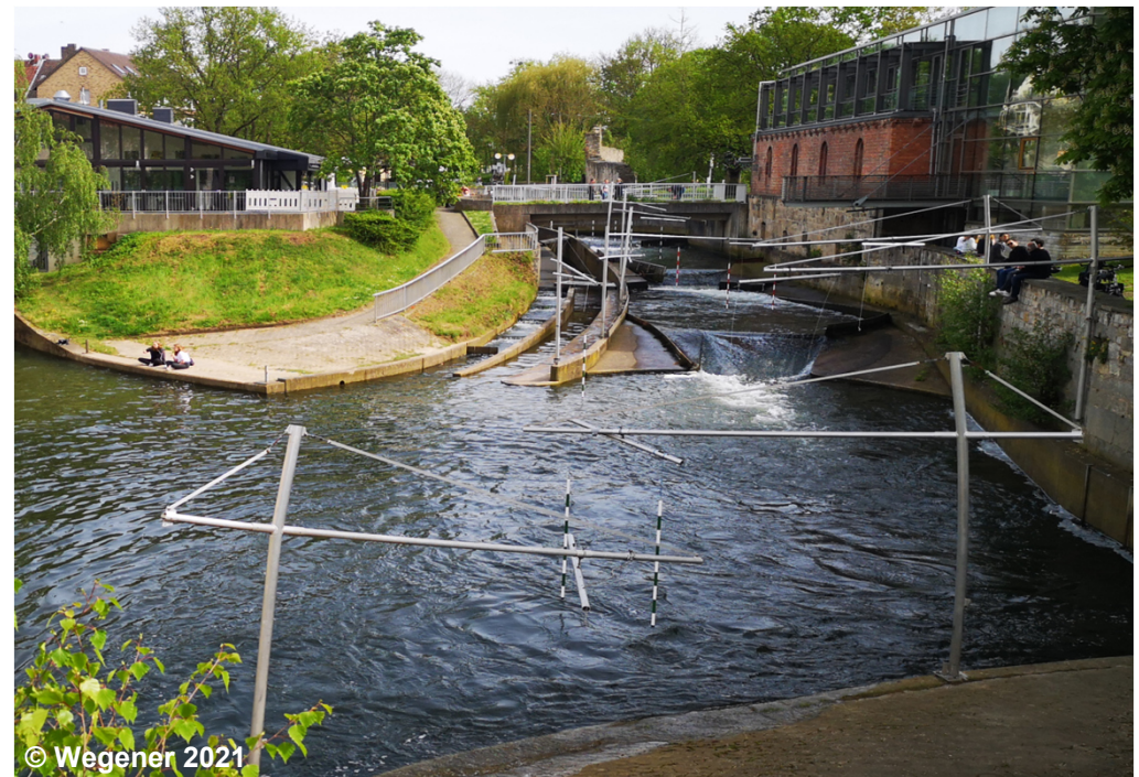
Blick auf die Sportanlage

FDV ART 1999 Fachunterlage istWeitereNutzung FDO IWN1000 Überlagernd↔ _AX_SportFreizeitUndErholungsflaeche↔ _FKT4100 Sportanlage FKT .... (G) ZUS .... HYD .... (G)