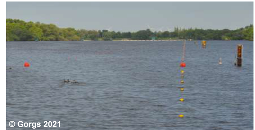
Blick auf die Sportanlage

FDV ART 1999 Fachunterlage istWeitereNutzung FDO IWN1000 Überlagernd↔ _AX_SportFreizeitUndErholungsflaeche↔ _FKT4100 Sportanlage FKT .... (G) ZUS .... HYD .... (G)