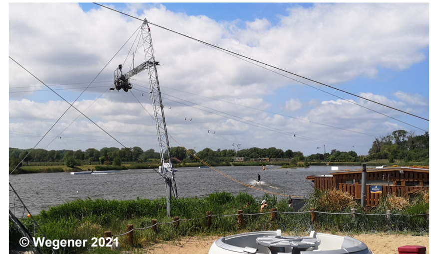
Blick auf die Freizeitanlage