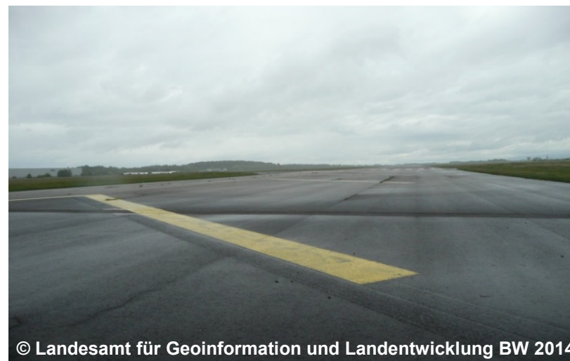
© Landesamt für Geoinformation und Landentwicklung BW 2014

Die Modellierung des Objektes erfolgt auf der Grundlage von Fachinformationen.