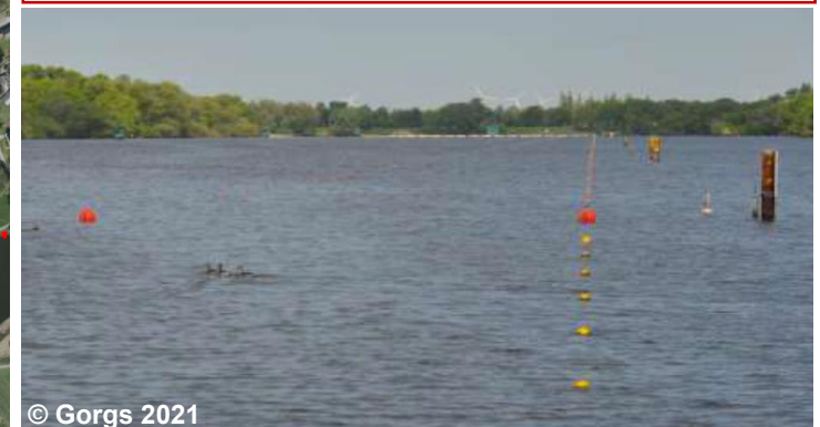
Blick auf die Sportanlage

Auszug aus dem Erläuterungsteil Kapitel 2.12.5