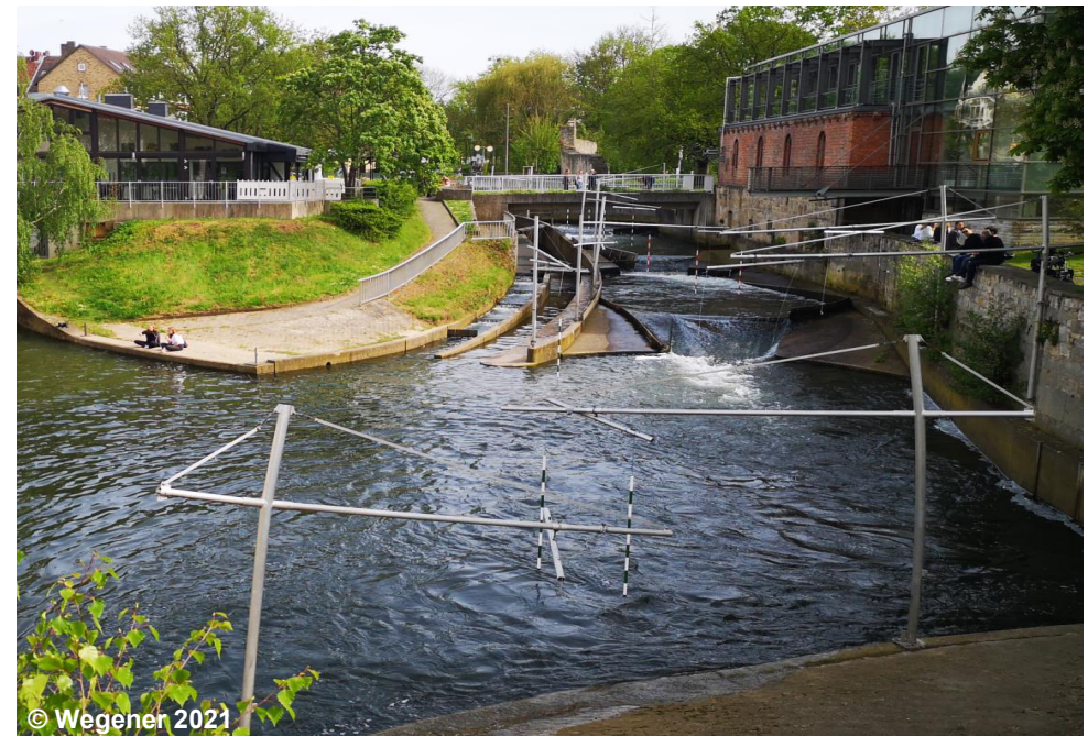
Blick auf die Sportanlage