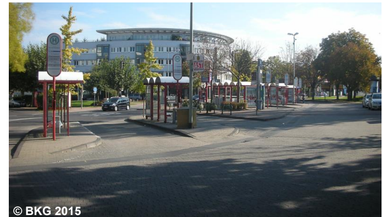
Blick auf einen Busbahnhof