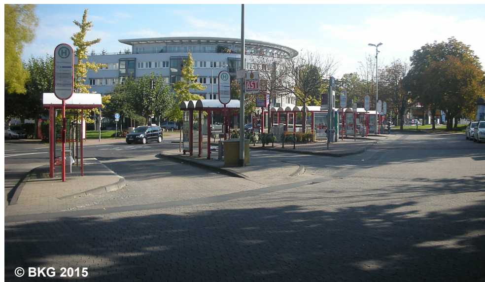
Blick auf den Busbahnhof