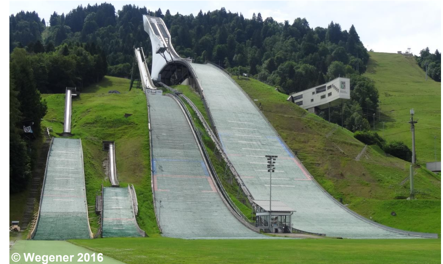
Blick auf die Sprungschanzen