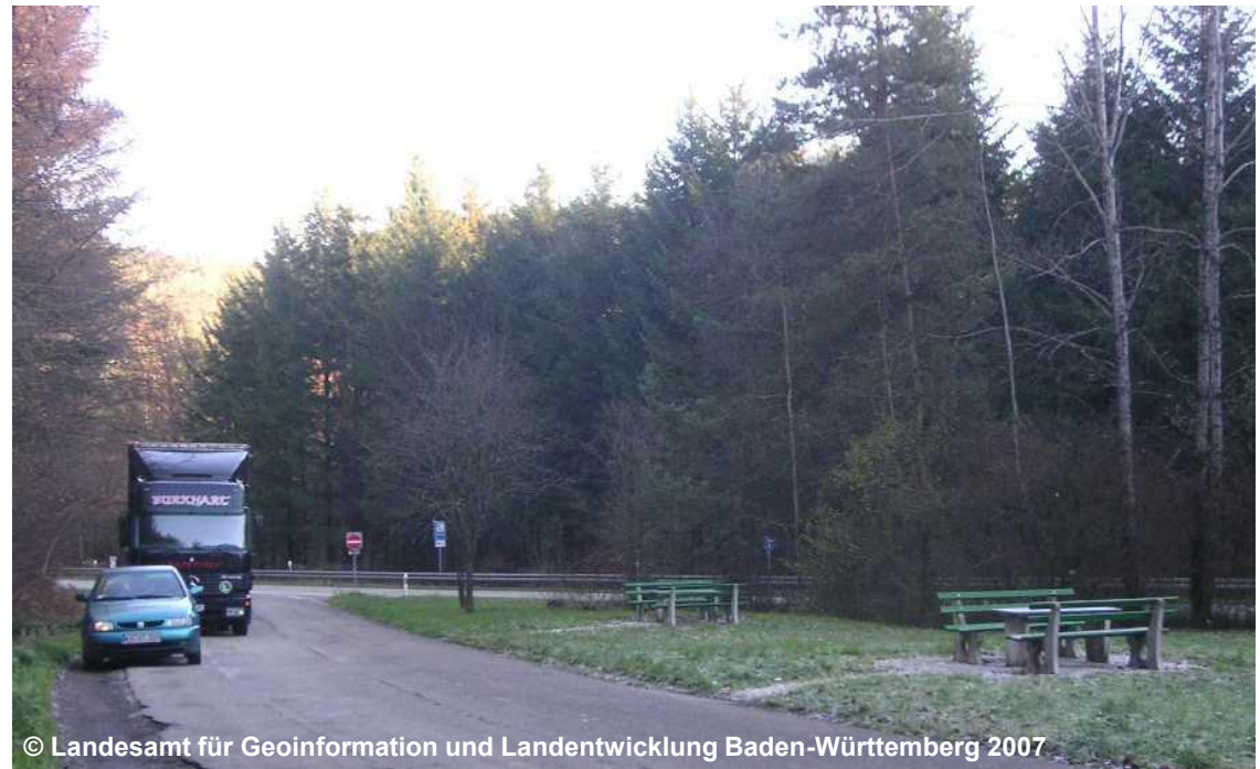
Blick auf den Rastplatz an der B492