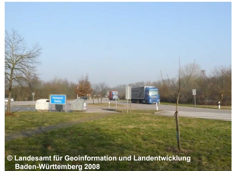
Blick auf den Rastplatz