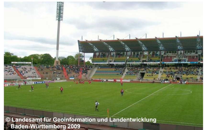
Blick in das Stadion, nicht überdacht