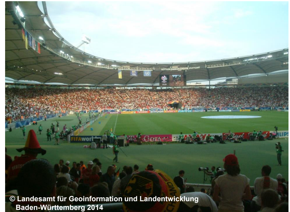
Blick in das Stadion, überdacht

In 'Stadion, überdacht' werden keine Zuschauertribünen und kein Spielfeld erfasst.