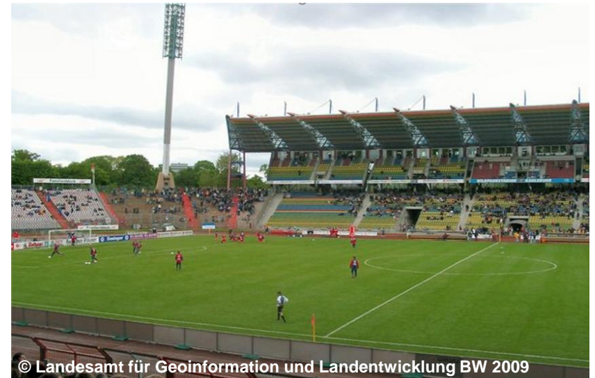
Blick in das Stadion, nicht überdacht

FDV ART 1900 Fachunterlage FDO BWF1442 Stadion, nicht überdacht BWF 1440 Stadion (G) NAM Wildparkstadion (G) SPO 1011 Fußball