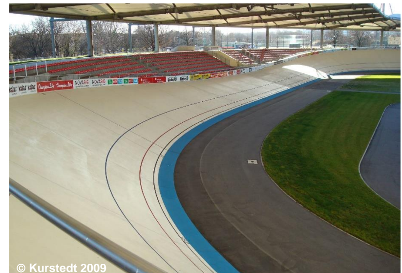
Blick in das Stadion, überdacht