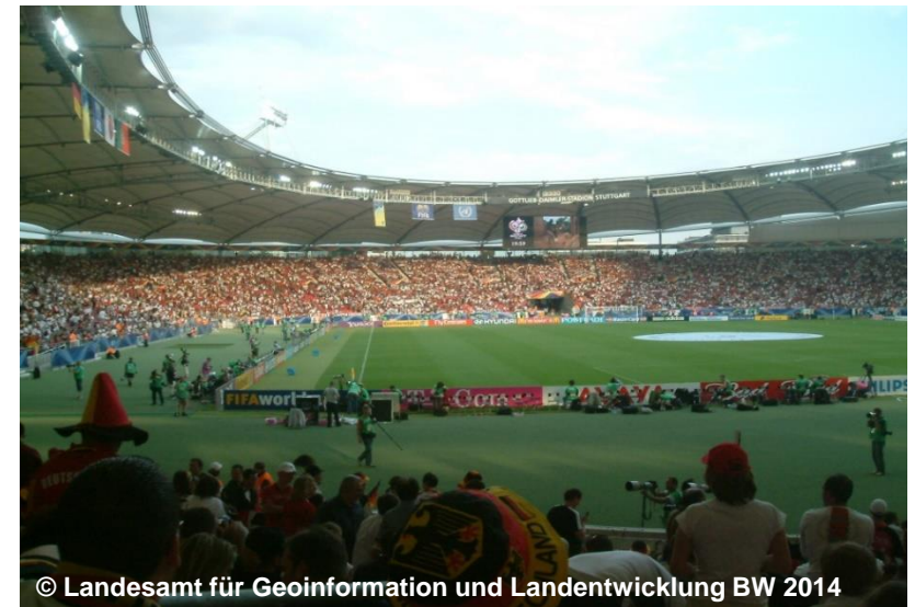
Blick in das Stadion, überdacht