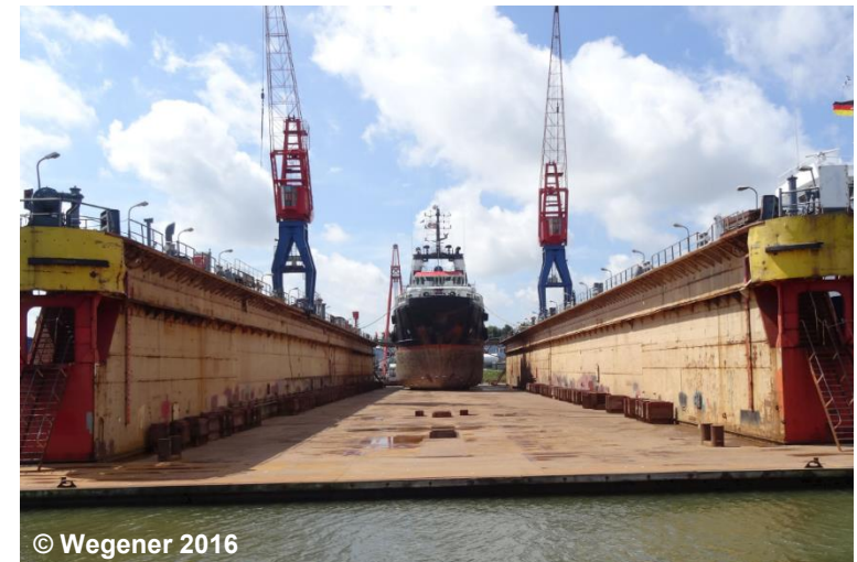
Blick auf das Trockendock