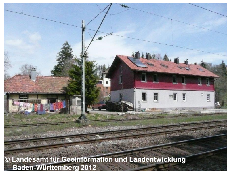
Blick auf den Bahnhof außer Betrieb, stillgelegt, verlassen