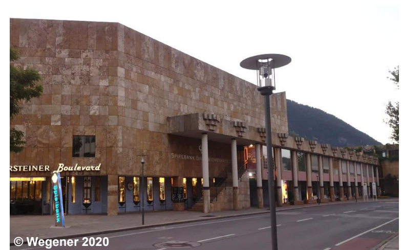
Blick auf die Spielbank

FKT 1480 Vergnügung BEZ .... NAM Spielbank Bad Reichenhall ZUS .... (G)