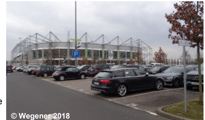
Blick auf die Sportanlage mit der Funktion Parken